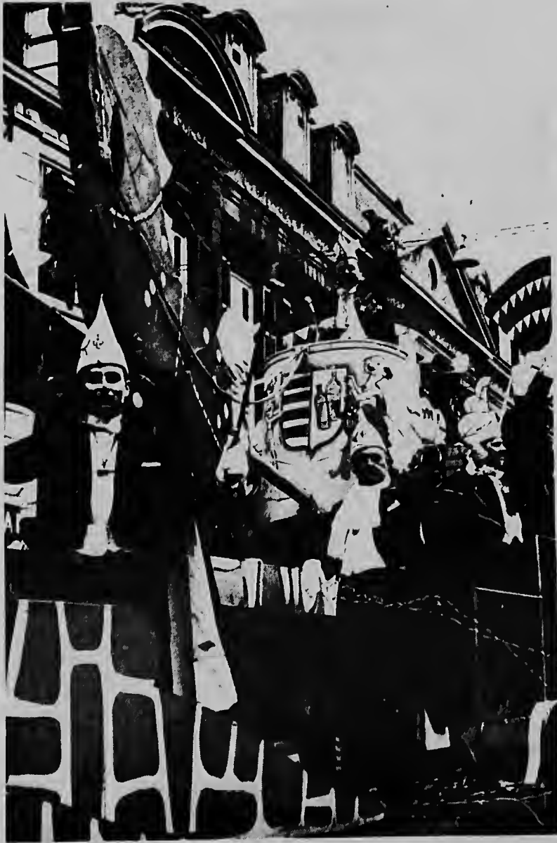
Aki un bista di e celebracion di carnaval na Hulanda cu a hala hopi turista.

E equipo di Pepsi Cola, cu originalmente a worde anuncia pa ta forma door di hungadornan di Socotoró, a cambia pa Paradera.